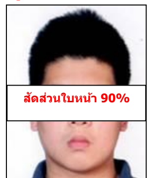
สัดส่วนใบหน้า 90%